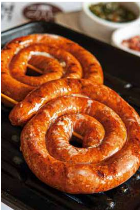
Chistorra Parrillera Artesanal