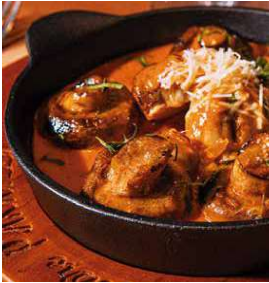
Champiñones al ajillo