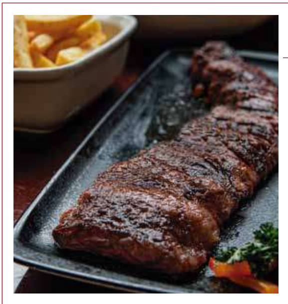
Entraña Fina ANGUS USA