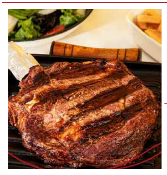
Cowboy Steak ANGUS USA