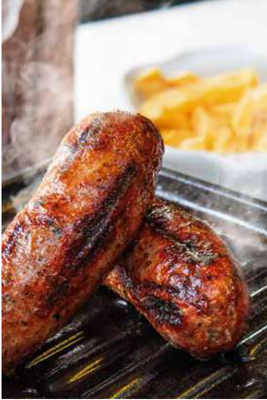
Porción de Chorizos Artesanales