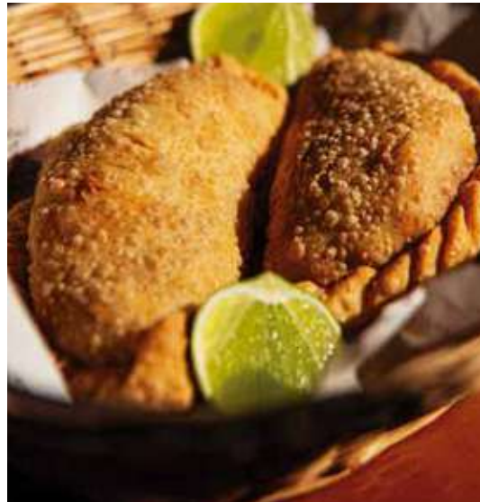
Dos empanadas de carne cortadas a cuchillo