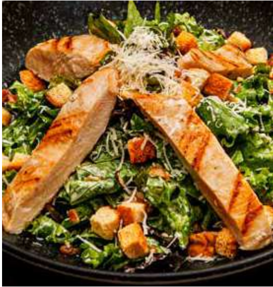
Ensalada Cesar's con pollo