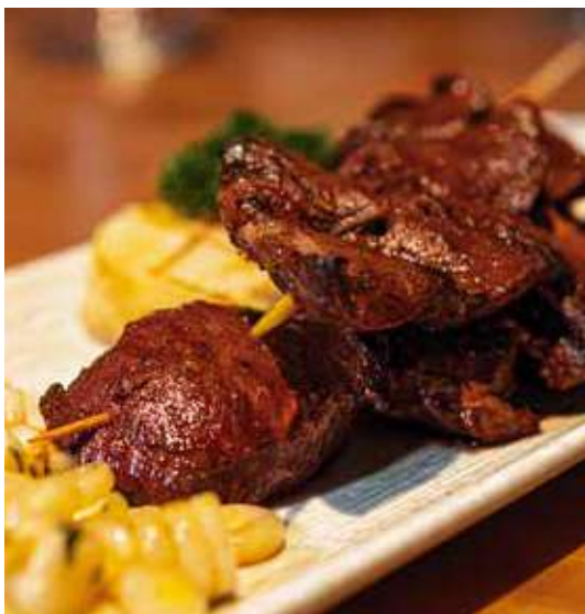
Anticuchos de lomo fino