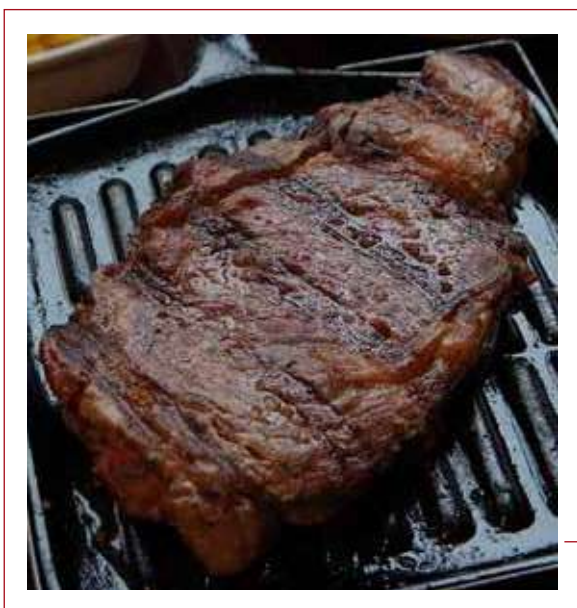
Bife Ancho ANGUS USA